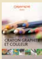
Crayons de couleur et graphite Réf. 100013.197