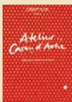
Atelier Caran d'Ache Réf. 454.302