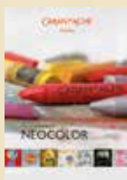
Neocolor Réf. 100011.682

La Maison Caran d'Ache propose une série de publications contenant de nombreuses suggestions et exemples de créations pour les cours artistiques à l'école. Ces dossiers pédagogiques peuvent être commandés au prix de CHF 5.- hors frais de port ou en format PDF via le formulaire de contact sur carandache.com.