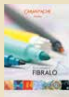
Fibralo Ref. 100016.453