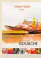
Gouache Réf. 100015.137